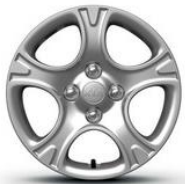
Llantas de acero 14'' con embellecedor