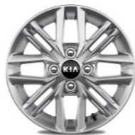
Llanta de aleación 14''