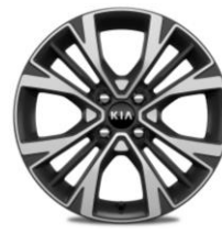
Llanta de aleación 16''