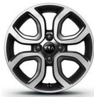
Llanta de aleación 15''